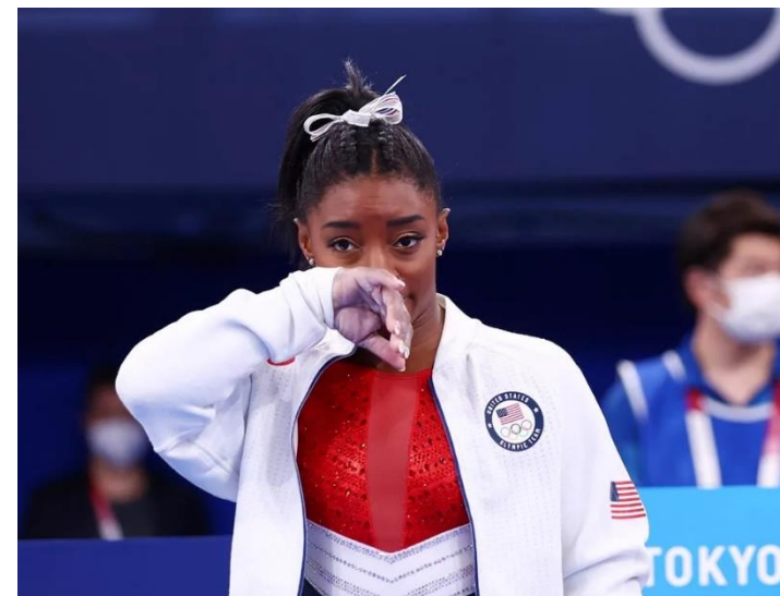
“Simone Biles es retira a la final dels JJOO amb 24 anys”

Un cop finalitzada la recerca, s'ha pogut arribar a un seguit de conclusions. Destaca el fet que el 40% dels esportistes acaben patint trastorns psicològics, pel fet que aquesta professió requereix una dedicació constant amb impossibilitat de desconexió, treballar sota l'expectació d'una multitud de gent i l'alta competitivitat.